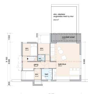
Plan 1. etg. 1:100